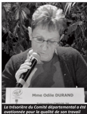
La trésorière du Comité départemental a été ovationnée pour la qualité de son travail

Le Conseil Général a versé le complément de la subvention fin janvier (1.500 €).